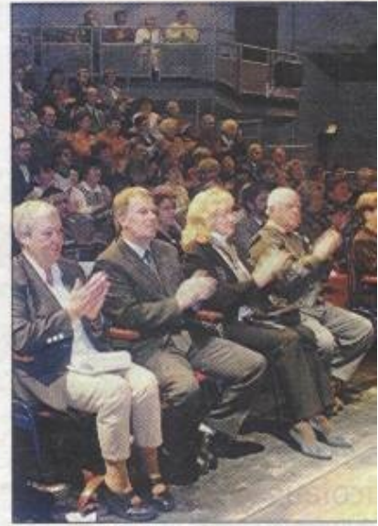
Applaus, Applaus. „Das Ehrenamt“ stand Sonntag i Bühne im Focus der lokalen Politprominenz.

Untereinander kennt man sich bei den Ehrenamtlern. Und so war die Veranstaltung im Theater ein Treffen von Freunden und Bekannten, die sich am Sonntag endlich mal die Zeit nahmen, auch an sich zu denken.